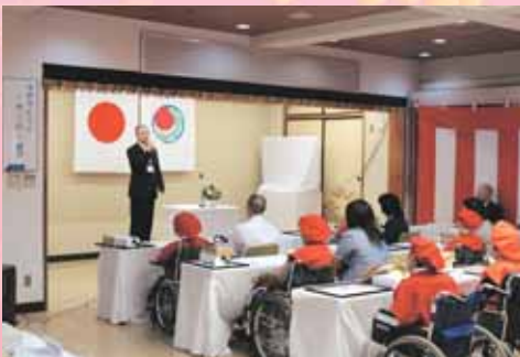
園長より皆様へお祝いの御挨拶