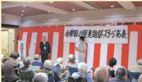
午前中は ステージ発表 楽しい余興が めじろおし