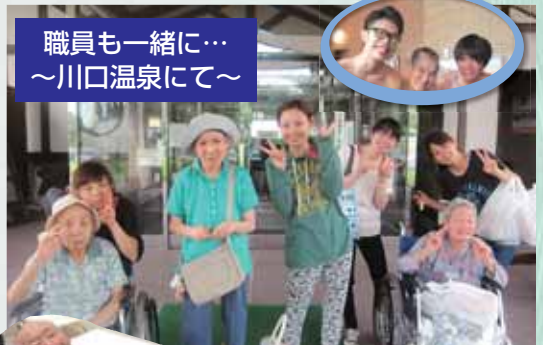
職員も一緒に… ～川口温泉にて～

温泉ツアーへも出掛けて来ました。また、毎月行われる【お風呂祭り】は、楽しみのイベントの1つとして定着しつつあります。