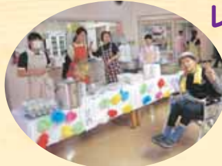
美人に囲まれて ごきげんです