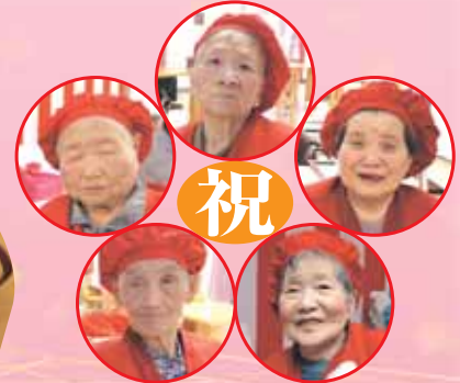
お祝い者の皆様 赤いちゃんちゃんこでおめかしです