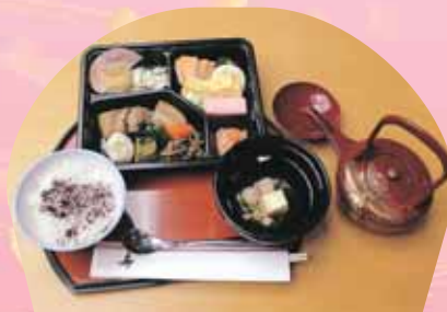
ごちそう沢山 お祝膳