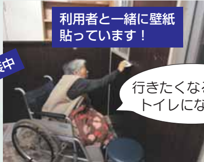
利用者と一緒に壁紙貼っています！