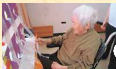
くじ引きコーナー