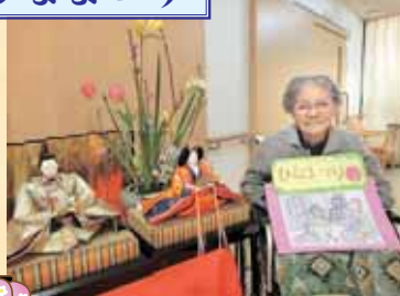
お雛様と一緒に ハイ・チーズ