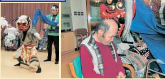
毎年、獅子舞のボランティアの来園でお正月の雰囲気が高まります。