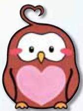
幸福ろう アイちゃん

これからは、新型コロナウイルスとの共存が言われています。一日も早くワクチンが実用化され、もそのような生活が送れるようになることを、心から願っています。重い話題が多いですが、このような時だからこそ、ご利用者の方からは「小栗田の里に行って楽しかった。」と言っていただけのように、元気で活気あるシヨートステイに、職員一同、一丸で盛り立てながら頑張っていきたいと思えます。これからもうすぐようすへ願っています。