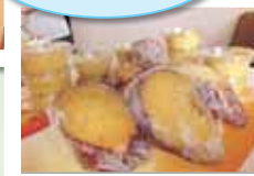
美味しく出来ました!! 秋の味覚を満喫♡