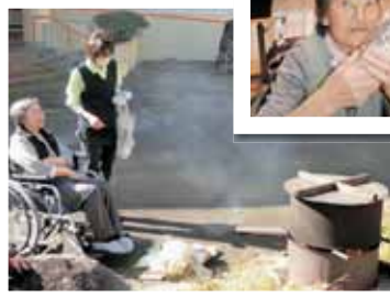
園庭で焼きました 美味しくなりますように