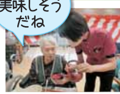
お昼はお祝い膳でした お祝い酒もどうぞ