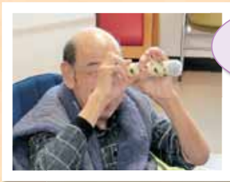
きれいに 見えるかな