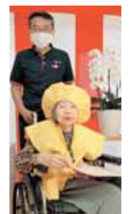
お祝いのちゃんちゃんこが 似合っています!! 益々元気で 長生きしてくださいね