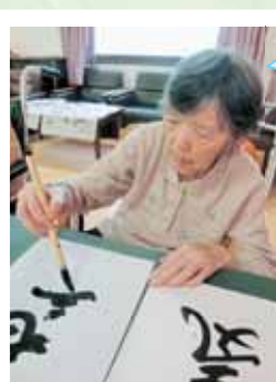
昔の思い出すね 墨のいい匂い