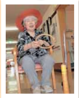
気分は カウボーイ!!