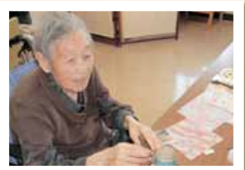
完成しました! キラキラして きれい