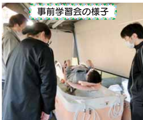
事前学習会の様子

を活用し、介護職員の労働環境向上のため、また入居者の負担軽減となる介護福祉機器として、令和2年12月18日に特殊浴槽を新しくしました。 より一層質の高いサービスを提供できるよう努めて参ります。