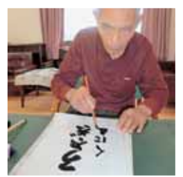
真剣な表情ですね