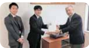
第四銀行小千谷支店様より寄贈いただきました。