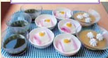
デザートバイキング