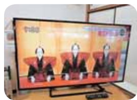
49インチサイズの大型テレビ。大切に使用させていただきます。