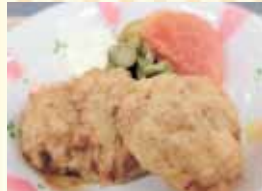
ソフトチキンナゲット