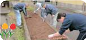
球根は、ご家族様と一緒に施設中央花壇に植えました。